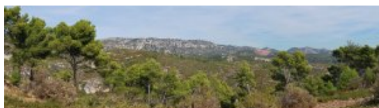
Massif de l'Étoile